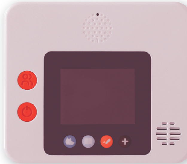
My English Pad